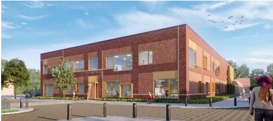
Nieuwbouw OBS Jules Verne. Vooraanzicht vanaf het van beuningen plein.